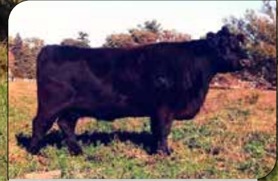
FORTUNA 1542, su madre.