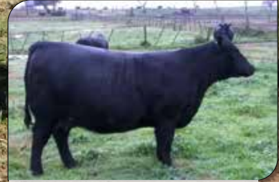
628, su madre.