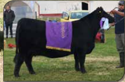
FORTUNITA 674, su madre