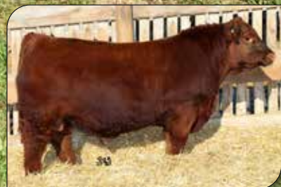
RED RENOWN, su padre.

Atencion!! Sus Deps lo indican como el toro de mayor FACILIDAD de ENGRASAMIENTO!! TOP GD 1%, GC 1%, AOB 1% Crecimiento (TOP PD 10%, PF 35%) Gran musculatura, precocidad, frame medio y muy buen color. Su madre Paraguaya 976, nuestra donante colorada número 1 y la que mejor nos representa en su fenotipo sumado a sus excelentes Deps de crecimiento y carcasa (20% PD, 15% PF, 3% EGD, 3% EGC, 1% AOB, 20% %GI). Su padre Red U2 Renown, una buena opción de sangre abierta en colorado con gran musculatura y ancho en su progenie sin perder calidad racial.