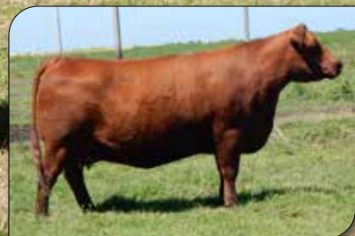
CRIOILLA 278, su madre.