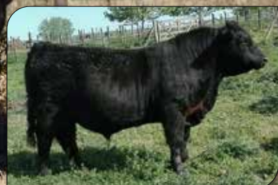
Estilo 1033, su padre