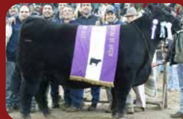
CAPRICHOSA 416 1 HIJA EN VENTA