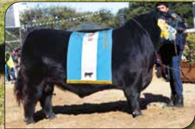
Heredero, su padre.