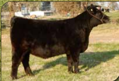
1264, propia hermana.