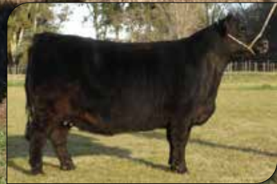
8790, su abuela materna.

FACILIDAD DE PARTO. Uno de nuestros preferidos! Un paquete genético difícil de igualar por su excelente pedigree, su volumen corporal facilidad de terminación y el respaldo de sus Deps. Su padre Coleman Charlo 0256, uno de los toros más completos y funcionales de los últimos años su progenie es superlativa combinando todas las características deseables para la producción de carne, gran facilidad de parto con buen crecimiento al destete y final destacada circunferencia escrotal, eficiencia en Consumo de energía, área de ojo de bife y facilidad de terminación. Su madre Euro tía 792 la incorporamos al plantel de donantes de la cabaña gracias a su excelente producción con varios padres, combina al consagrado Euro con la 8790 de muy buen volumen y calidad de ubre. TOP 1% LG, 30% PN, ALT 10%, AOB 10%, GD 4%, GC 5%, GI 25%.