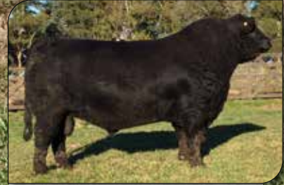
ZORZALITO, su padre.