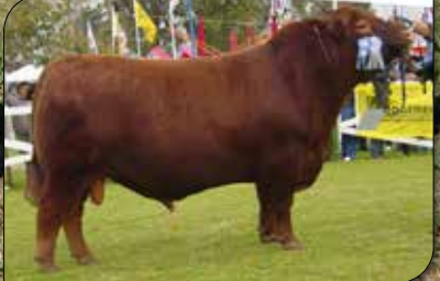
Payador, abuelo materno.