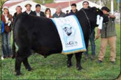
DF Papá Viejo 599, su padre.