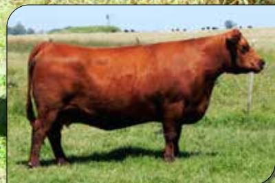
Criolla 278, su madre.