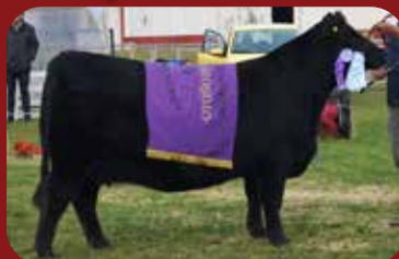
FORTUNITA 674 2 HIJAS SE VENDEN