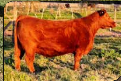
PARAGUAYA, propia hermana.

Calidad racial difícil de igualar en colorado sumado corrección en sus líneas en un frame moderado. Propio hermano de gran Paraguaya 976, nuestra donante colorada número 1 y la que mejor nos representa en su fenotipo sumado a sus excelentes Deps de crecimiento y carcasa (20% PD, 15% PF, 3% EGD, 3% EGC, 1% AOB, 20% %GI) Su padre Guarani de muy buena clase, destacados Deps de crecimiento al destete y final (10% superior) y sobresaliente facilidad de terminación ubicándose dentro de los superiores para espesor de grasa dorsal y espesor de grasa a la cadera y porcentaje de grasa intramuscular del cual lamentablemente no hay más semen. DEPs destacados para: LG 20%, PD 20%, GD 15%, GC 35%.