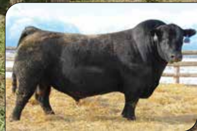
Charlo, su padre

FACILIDAD DE PARTO. Una buena combinación de parto fácil con tamaño moderado y buen engrasamiento! Deps Superiores para: LG 3%, PN 20%, LECHE 10%, ALT 15%, GD 15%, GC 15%. Su padre Coleman Charló 0256, uno de los toros más completos y funcionales de los últimos años, su progenie es superlativa combinando todas las características deseables para la producción de carne, gran facilidad de parto con buen crecimiento al destete y final destacada circunferencia escrotal, eficiencia en consumo de energía, área de ojo de bife y facilidad de terminación. Su madre Hechicera 962, de muy buena clase producto de 2 padres consagrados Zorzal y Crédito.