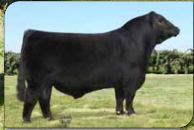
Silveiras Style, padre de la 1350