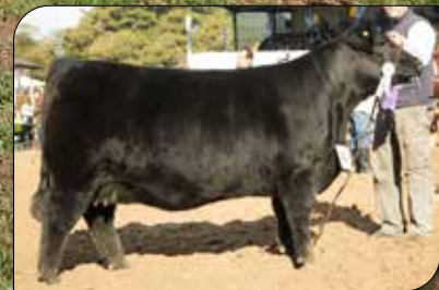
FRANCISCA 710, su madre.