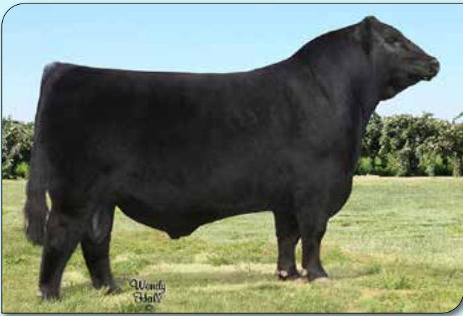
Silveiras Style 9303 Gambles Hot Rod x Silveiras Elba 2520