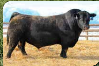
Charlo, su padre