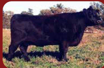
FORTUNA 1542 1 HIJA EN VENTA