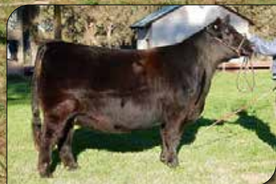
808, su madre.