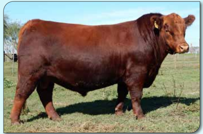
Don Florencio 627 Guarani T/E Quebrantador x Don Florencio 466 Brigada 328