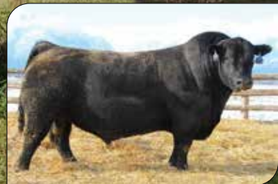
CHARLO, su padre.