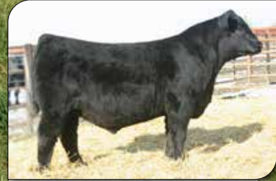
Brillance, su padre.