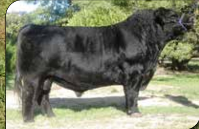
Maxi, abuelo materno.