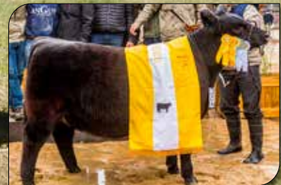
1084 Brilla La Princ, propia hermana