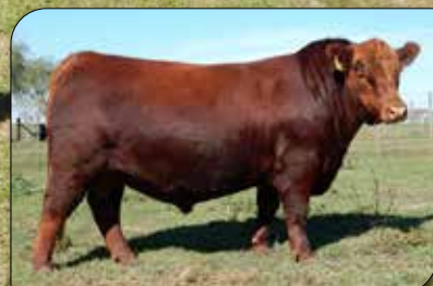
GUARANÍ, su padre.