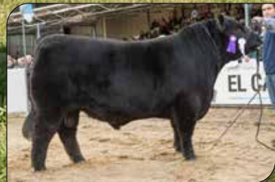
Boletero 517, propio hermano.