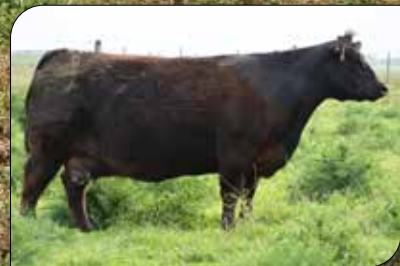
MANOLA 8306, abuela materna.