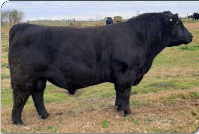
Don Florencio 1161 Mundial Mundialista x Don Florencio 758 Maxi Tomasa 432