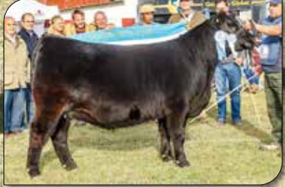
Su propia hermana, GC Hembra Otoño 19