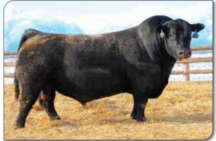
Coleman Charlo OCC Paxton 730P x Bohi Abigale 6014