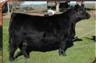
DF FRANCISCA 710, su gran madre.