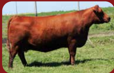
CRIOILLA 278 2 HIJAS SE VENDEN