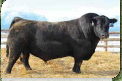
CHARLO, su padre.