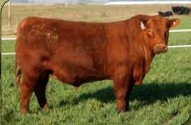
RP 1141, Hermano materno 1391