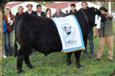
DF Papá Viejo 599, su padre.