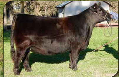
808, su madre.