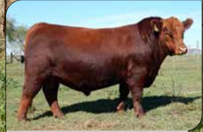
GUARANÍ, padre RP 1285.