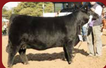
FRANCISCA 710 2 HIJAS SE VENDEN

LA VENTAJA DE LO PREDECIBLE Vendemos hijas de estas donantes