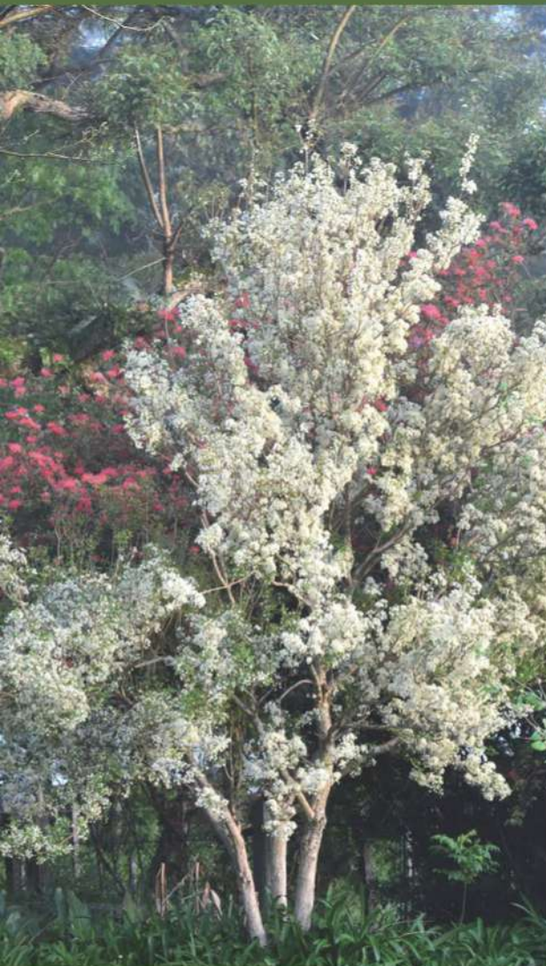
Pintanga en flor ( Eugenia uniflora )

Basamos nuestra selección en un gran número de vacas que manejamos bajo condiciones de pastoreo extensivo en conjunto con ovejas, asegurando la adaptación de nuestra genética a las más exigentes condiciones ambientales.