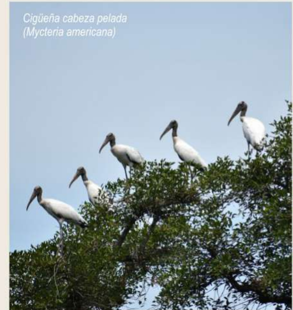
Cigüeña cabeza pelada (Mycteria americana)