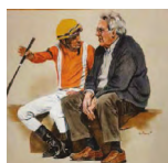
HARAS DON BEBE