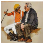
HARAS DON BEBE