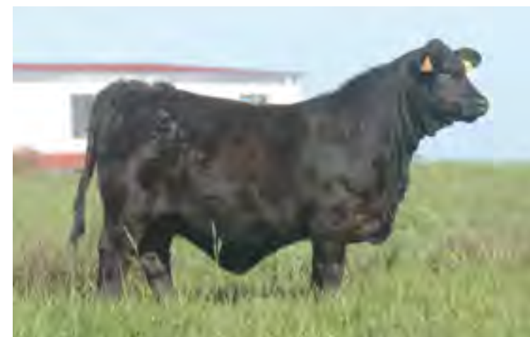
Hija de Nando x 875