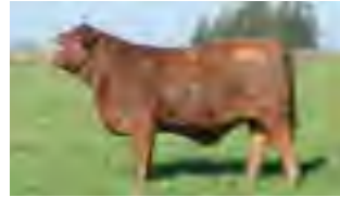
RP 1154, su madre

TRANSPARENCIA, OBJETIVIDAD Y CONSTANTE EVOLUCIÓN