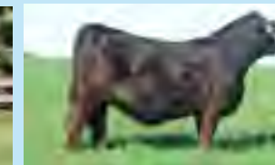
RP 1215, su madre