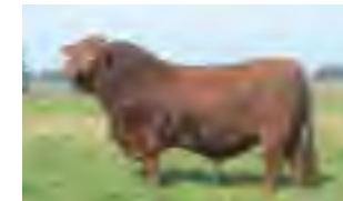
Alemán, su padre