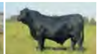
Consistente, hno entero