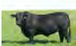
Temporal, su padre