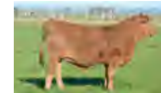
RP 667, abuela