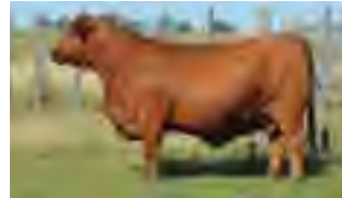
RP 667, bisabuela de ambas