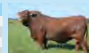
Nando, su padre