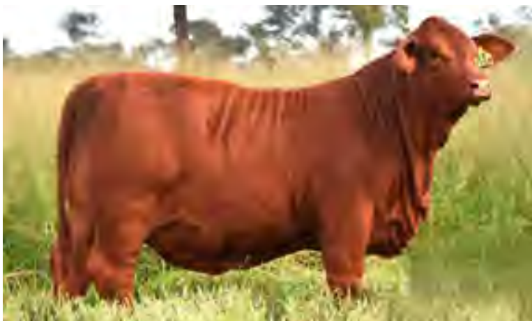
Hija de Nando en San Alejo, Argentina