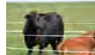
RP 73, bisabuela