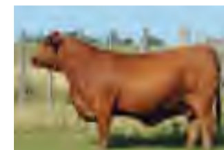
RP 667, su abuela