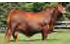
Tabasco, su padre