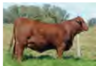
RP 708, abuela paterna