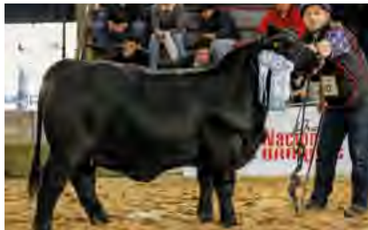
Campeona de bozal Nacional 2022, Argentina