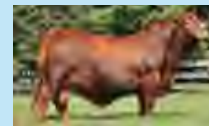
Tabasco, su padre