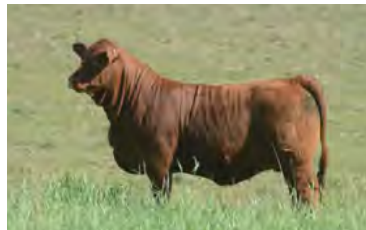
Hija de Nando, precio máximo remate El Coraje 2021