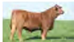
RP 1212, madre de 1361