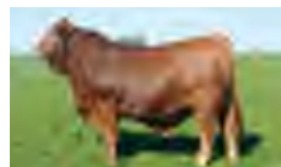
Mostaza, padre del 2014