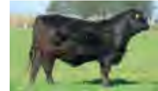
RP 1183, su madre