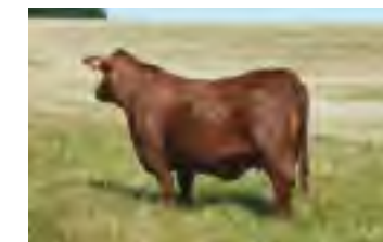
RP 106, tatarabuela