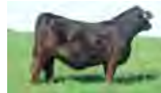
RP 1215, su madre