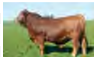
Mostaza, hno entero