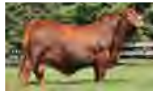
Tabasco, su padre

Trio de jóvenes toros hijos de la 1183, donante que adquirieron nuestros amigos de cabaña Don Nadir de producción muy homogénea. Estos hijos de tabasco se muestran con alto nivel de acebuzamiento y calidad racial, sumado a mucho ancho en su posterior y muchas generaciones de Brangus productivo.