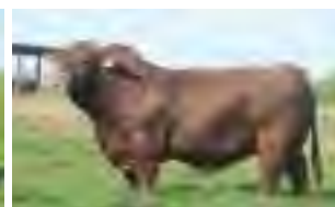
Drago, hno entero