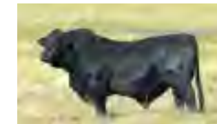
Mazacote, su padre