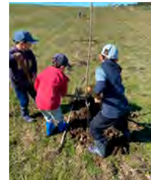
Plantando monte de nogales la Séptima generación en el mismo campo