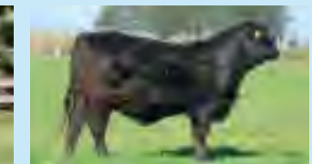
RP 1183, su madre