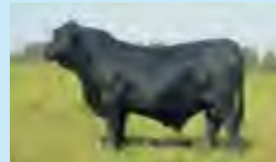
Consistente, hno entero