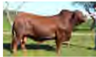
Pancho, abuelo paterno