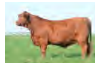
RP 941, su madre