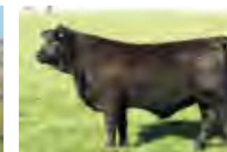
RP 266, su bisabuela materna