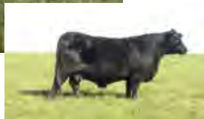
RP 79, Tatarabuela de ambas