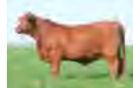
RP 941, su madre