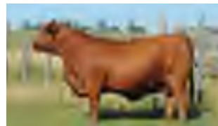
RP 667, su abuela

Productivo por donde se lo mire, el 1387 se muestra sumamente manso, correctísimo en su línea inferior, profundo, blando de engorde y con facilidad de parto. Su distribución de la grasa es muy buena y su marbling en relación a sus 15 meses también. Su madre fue precio máximo en el 2020 adquirida por cabaña La Medalla de Corrientes Argentina y su abuela la increíble 667. ¡¡ATENCIÓN A OTRO GRAN PADRE COLORADO CON MUCHO ÉNFASIS EN PRODUCCIÓN DE LOS QUE NO ABUNDAN!!