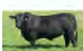
Temporal, su padre