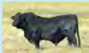
Mazacote, su padre

S. Colectivo Del Infante 1059 Del Infante 5391