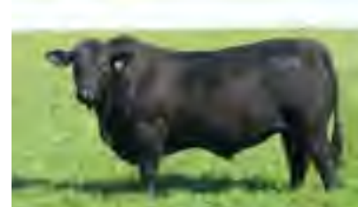
Temporal, padre de ambas