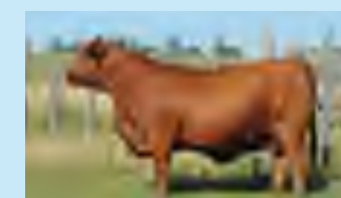
RP 667, su abuela materna