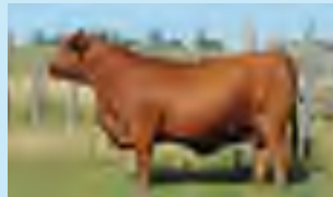
RP 667, su madre