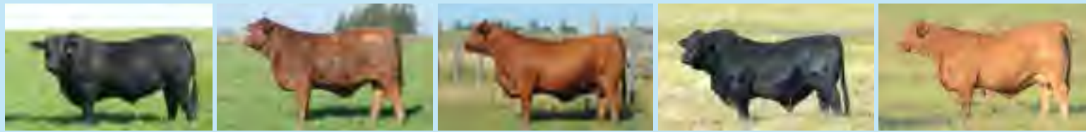
Temporal, su padre