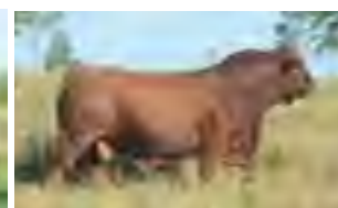
Forlán, hno entero