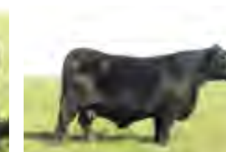
RP 79, su tatarabuela