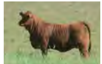
RP 1289, precio máximo 2021. Hna materna