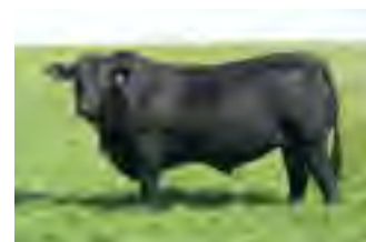
Temporal, padre de ambos toros

Uno de los toros mas productivos generados en El Coraje. En el encontramos facilidad de parto extrema, máxima blandura de engorde y mantenimiento (dío servicio a los 15 meses...) y un temperamento 5 estrellas. Su % de grasa intramuscular es de 4.06, su hermano materno es Criador toro padre adquirido por nuestro amigo Enrique Bengoechea el cual situaba sus hijas muy por encima del promedio en marbling. Su madre la 284 la medimos de adulta criando y a campo natural y arrojó como resultado 8,7% de grasa intramuscular, en otras palabras, lo mismo que un wagyu a feed lot o que un corte de carne calificación Prime. Para quienes estamos en la búsqueda de mejorar calidad de carne nos damos cuenta que estamos frente a un toro único en este aspecto que además sirve para 15 meses, mejora temperamento y corrige línea inferior.