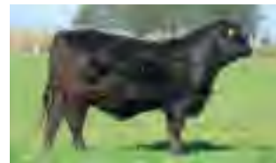
RP 1183, su madre