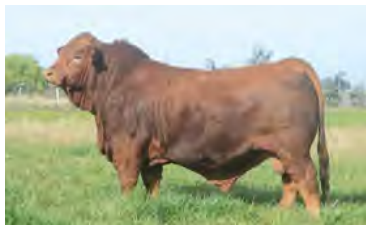
El Carnicero, Nando por 1119