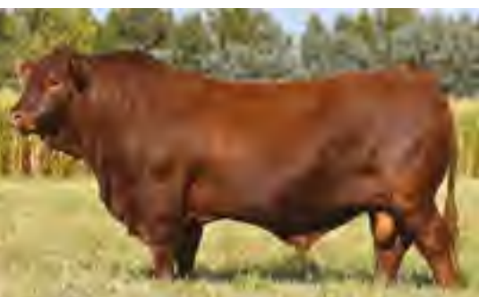
Charrua, toro padre en Las Lilas, Argentina