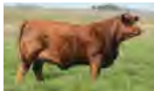
RP 1182, su madre