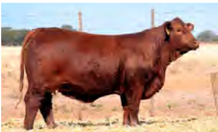
Hija de Nando en quilpo norte, Argentina