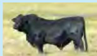
Mazacote, su padre