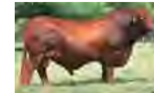
Pimentón, su padre

Dúo de toros jóvenes con la preparación justa, con muchísima precocidad y excelente temperamento. Ellos son hermanos enteros del RP 1387 (corral 16) uno de los mejores toros de esta oferta. ¡¡PRECOCIDAD Y CONSISTENCIA ASEGURADA!!