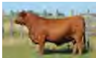
RP 667, madre de ambos