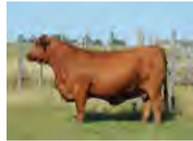
RP 667, su abuela