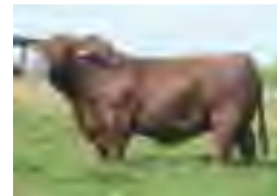
Drago, su padre