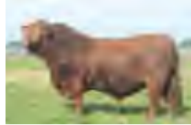
Alemán, hno materno