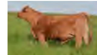
RP 937, su madre