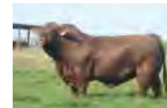
Drago, su padre