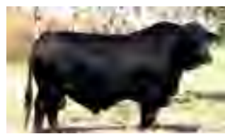
Yas, abuelo materno