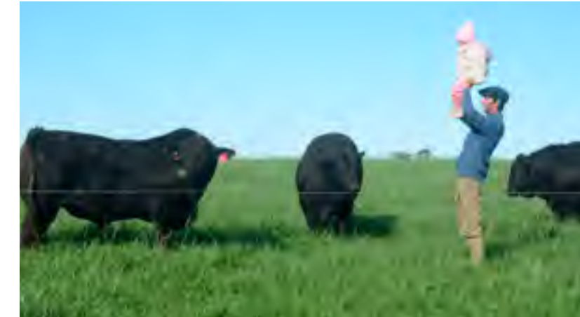
Intentando que pose para la foto pero no...