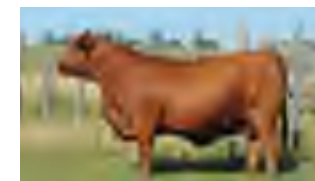
RP 667, su madre