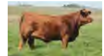
RP 1182, su madre