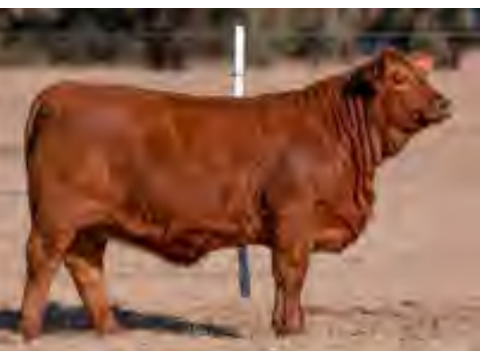
Hija de Nando en Corral de Guardia, Argentina