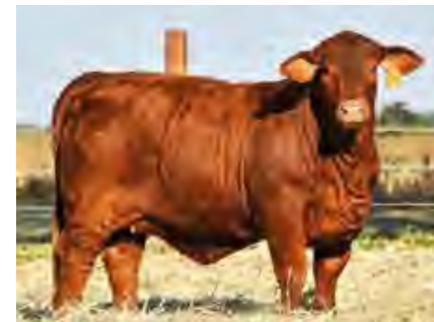
Nandina, precio máximo remate Las Lilas 2021 (Argentina).