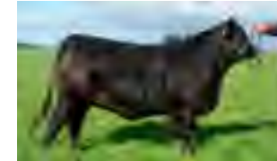
RP 865, abuela materna