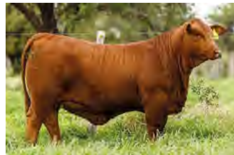
Hija de Nando en El Porvenir de Orodá (Argentina)