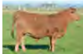
RP 1020, su madre