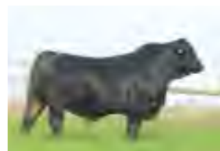
Criador, hno materno