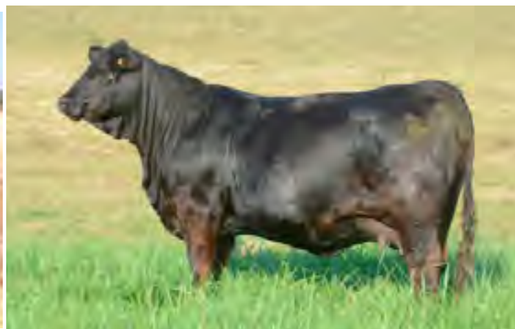
Hija de Nando x 1107