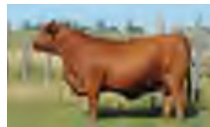
RP 667, su abuela