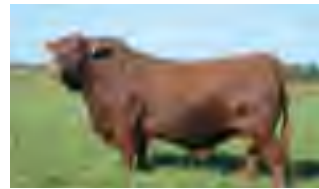
Nando, su padre

Atención a uno de los toros más completos de esta venta. "Comercial" hereda todas las cualidades como calidad racial, volumen y blandura de engorde de su padre el gran Nando, además posee un prepucio perfecto y muy buen temperamento. Todo esto en un frame 3 pero con una corpulencia tremenda. Su madre la 488 tiene en la actualidad 8 años y 7 crías.