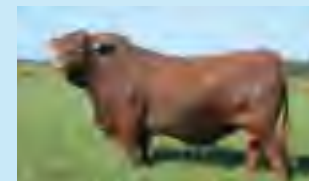
Nando, su padre