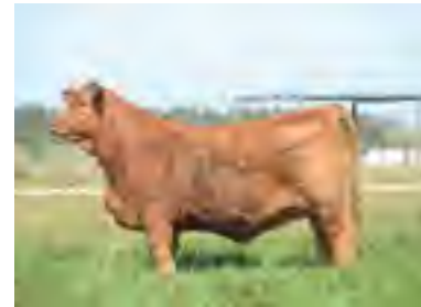
RP 1188, Mili madre de ambas