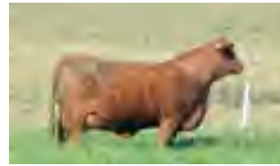
RP 1152, su madre