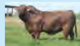
Drago, su padre