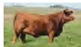
RP 1182, su madre