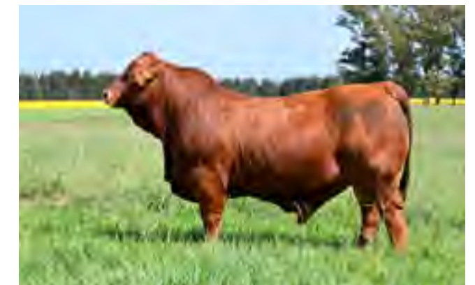
RP 1320, hermano entero