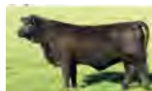
RP 266, su madre