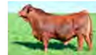
RP 1387, hno entero de ambos