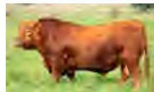
Lucuma, su padre

Todo lo que buscamos en un Ultrared lo encontramos en el 2031. Muy manso, de gran volumen corporal, frame 3,5. Muy blando de engorde, masculino y ancho de atrás. Sus datos de carcaza son excelentes y además tiene facilidad de parto siendo hijo de una vaquillona preñada a los 14 meses.