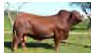
Pancho, abuelo paterno