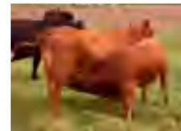
RP 610, su abuela con Tommy al pie

¡¡Atención al primer hijo de Drago en aparecer a la venta!! El 1320 se muestra muy largo, anchísimo de atrás, con alto nivel de acebuzamiento y una cabeza soñada! Su padre uno de los toros más atractivos que conozcamos y de gran consistencia en su producción. Su madre la 914 fue precio máximo en el 2019 y además una de sus hijas fue la donante precio máximo el año pasado. Su abuela la 610 es hermana entera de Pancho y además madre de Tommy. Ideal para quienes buscan físicos muy atractivos y gran calidad racial.