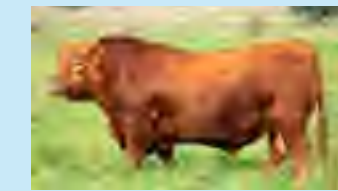
Lucuma, padres de ambos

Tremendos toros Ultrared hijos de vaquillonas entoradas con 15 meses. Progama que lleva 15 años ininterrumpidos en la búsqueda de facilidad de parto extrema y alta precocidad sexual de hembras alimentadas a pasto. En ellos encontramos mucho volúmen, facilidad de parto y gran musculatura.