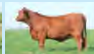
RP 941, su madre