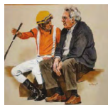
HARAS DON BEBE

ORB en una madre que ya produjo dos ganadores a los 2 años