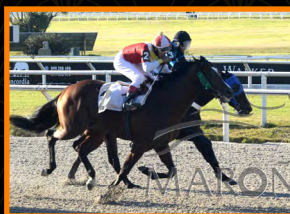
UN SER SUPERIOR GP Presidente de la Republica (G3)