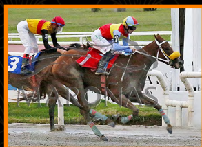
ANDABA DE PARRANDA