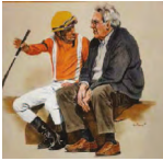
HARAS DON BEBE

THE LEOPARD en una madre ECCLESIASTIC con línea materna clásica