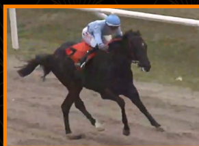
ENTREGUEN LA GUITA