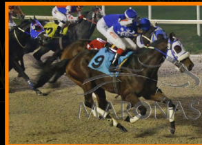
POSEIDON INC Clás. Campeones Sprint