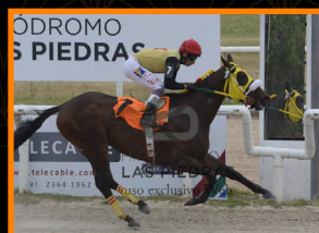
PLURALISMO Clás. Ensayo