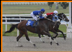
PALETA QUEMADA Clás. Brasil (G3)