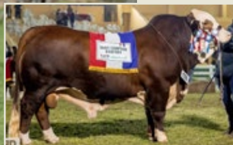
CRÍA DE LA DONANTE