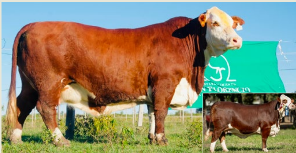
PRODUCTO DE LA COMBINACION