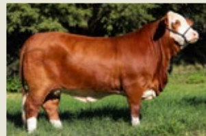
CINTIA RESULTADO COMBINACION