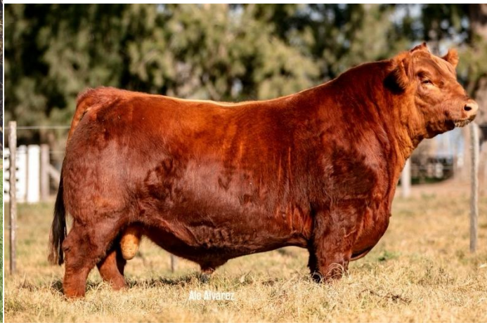
Rubeta 8320- Virrey