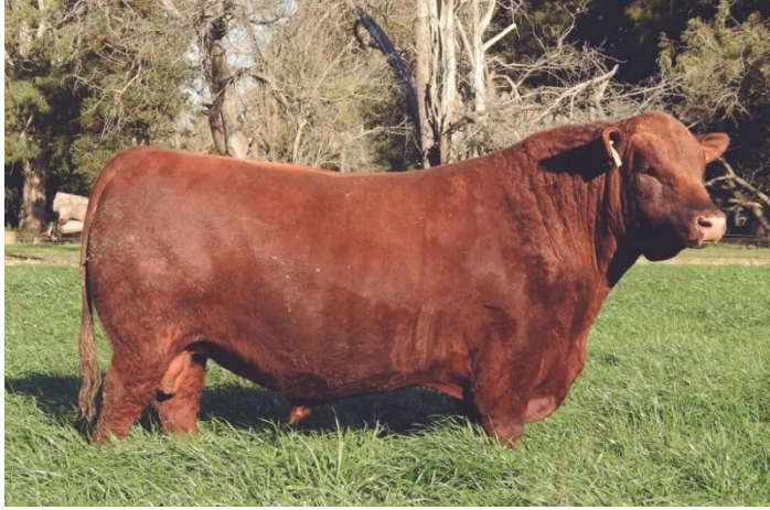
Esencial 721- Horus