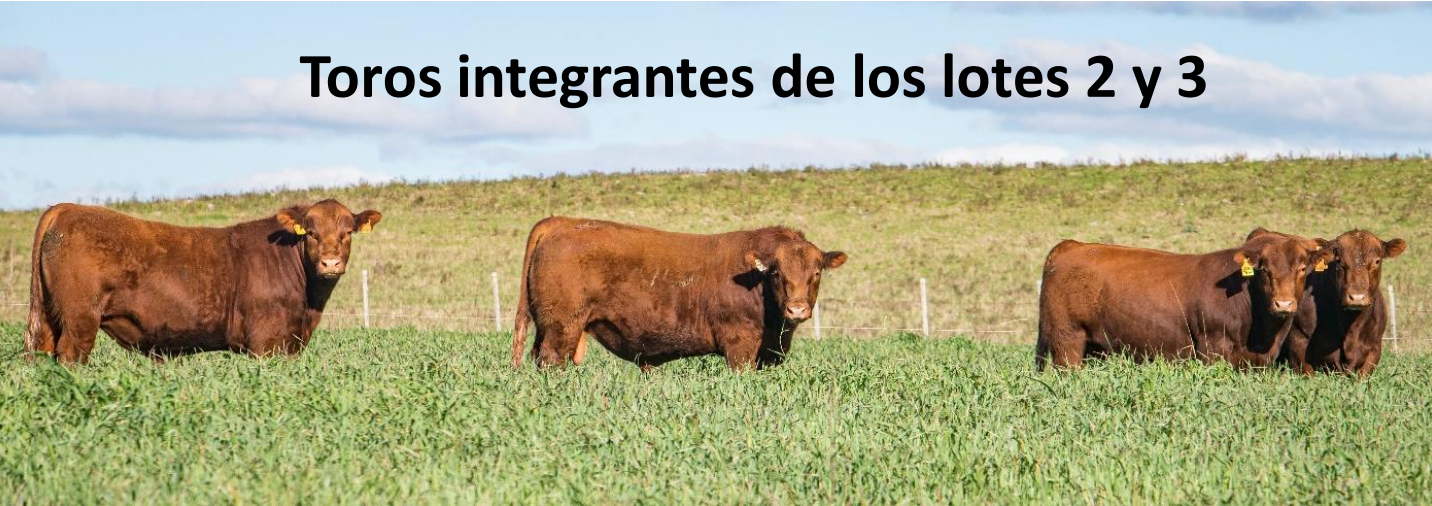
Toros integrantes de los lotes 2 y 3