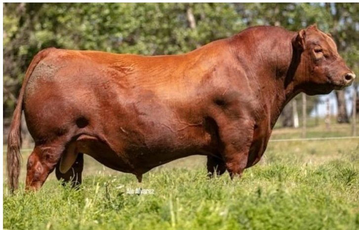
Erre Te 1195 Frank Génesis FIV-Génesis