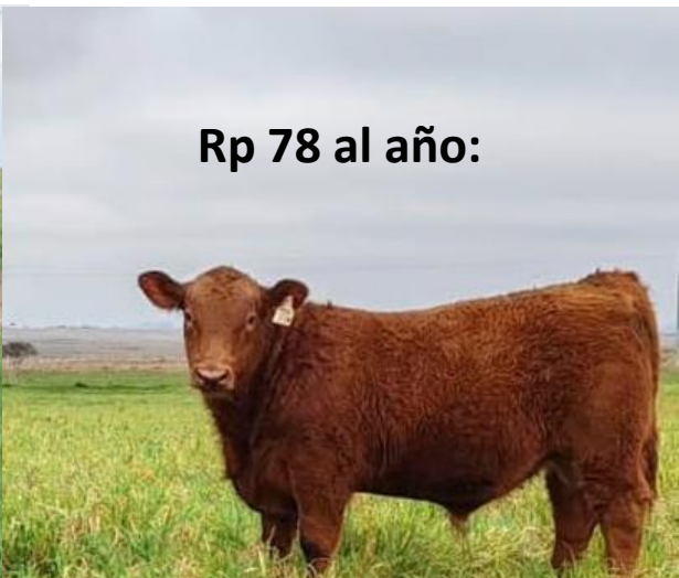
Rp 78 al año: