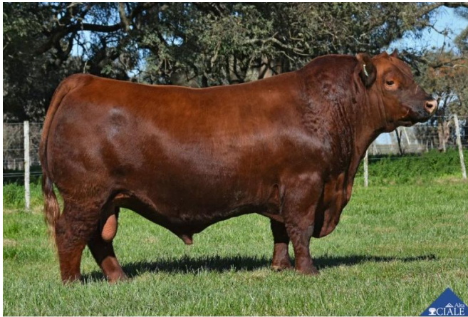
Pastoriza 1548- Trueno