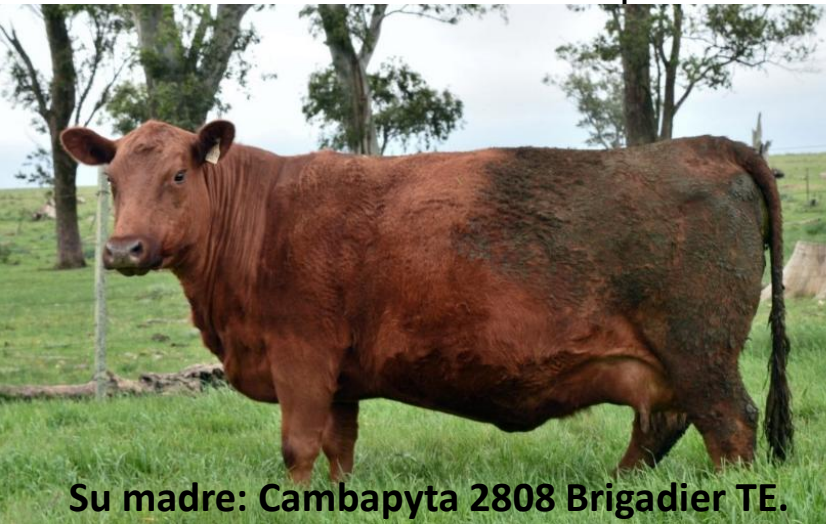
Su madre: Cambapyta 2808 Brigadier TE.