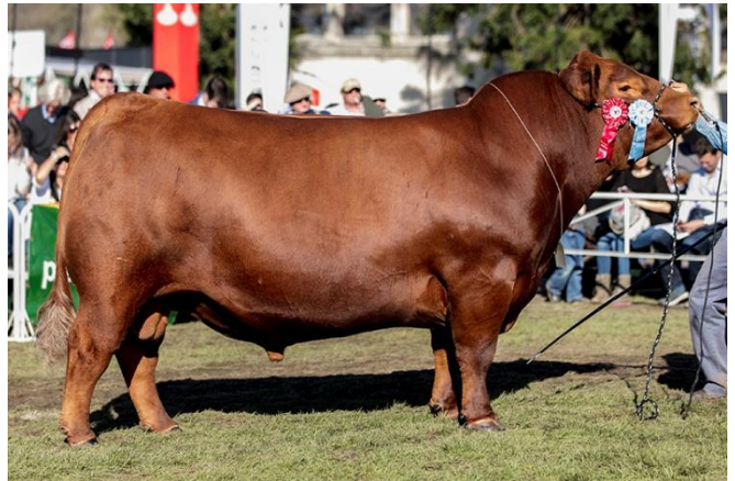
EC Carlon 509- Prolijo